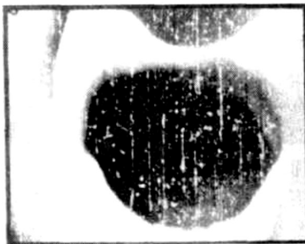
图 1.8-图 1.9 《鲸吞》剧照。此时被激怒的主人公似乎“吞食”了摄影师和摄影机 史密斯拍于 1903 年的怪异喜剧《玛丽·珍妮的灾难》(Mary Jane's Mishap)就使用了相当复杂的剪辑手法。