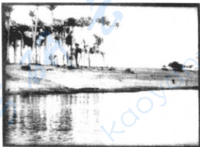
图 1.1 卢米埃尔的摄影师尤金·普洛米奥把他的摄影机放在运动的船上所拍摄的一些影片对当时的电影工作者产生了极大的影响，其中包括《埃及：尼罗河沿岸的风光》(Egypt: Panorama of The Banks of the, 1896)一片。

普洛米奥与其他电影工作者继续这一试验，常常把摄影机放在船上或火车上拍摄(图 1.1)。这种类型的移动镜头以及此后不久出现的摇镜头，大多出现在这一时期的风景电影与时事电影中。