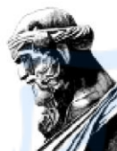
▪ 柏拉图: 《理想国》、《美诺篇》