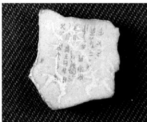
陕西西周甲骨文/甲骨文原来多指殷墟所出卜辞等,但近年来各地发现了不少周人有文字的甲骨,如陕西省西安市董家村出土的三片卜骨,山西省洪洞县曲沃村出土的一片卜骨,北京市昌平白浮村出土的三片卜甲,陕西省岐山凤雏村出土的二百八十九片卜甲,扶风齐家村出土的一片卜甲、六片卜骨等,其中尤以岐山、扶风所出最为重要,片数较多,不同文字在二百五十字以上。图为岐山凤雏周凤雏遗址出土的西周甲骨。